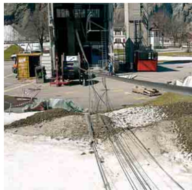
Seilzug der neuen Tragseile mit integriertem Lichtwellenleiter

In unserem Standortkanton durften wir diesen Seilzug im steilsten Gelände ausführen und damit für die Besucher auch ein wunderbares Wandergebiet von der Muttsee-Hütte mit Kistenpass nach Brigels erschliessen.