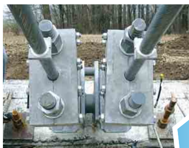
Verankerung der Tragseile

Als Generalunternehmer realisieren wir diese Hängebrücke. Nach aufwändigem zweijährigem Bewilligungsverfahren und mit engem Kostenrahmen bauten wir die neue Brücke in nur vier Monaten. Mit 93 m Spannweite wird sie fast zur Sprintstrecke, 1,5m beträgt die Stegbreite aus Beton. Eine schwere Konstruktion wurde gewählt, um die Schwingungsneigung zu minimieren. Zwei Tragseile mit 46mm Durchmesser tragen die 70 Tonnen schwere Brücke. Diesen gemeinsamen Brückenschlag feierten die Gemeinden mit einem Volksfest.