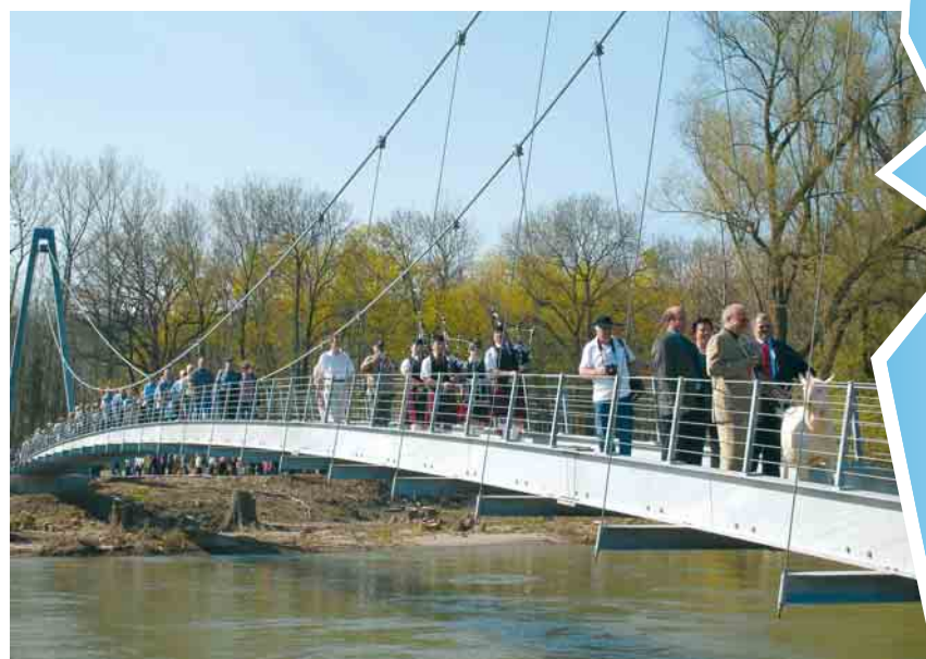
Politische Prominenz und der Sage entsprechend als Erster ein Geissbock überqueren an der Eröffnung die Hängebrücke.

Die neue Hängebrücke von Inauen-Schätti AG überspannt die Aare zwischen Gretzenbach und Niedergösgen. Schwungvoll verbindet sie die Aarelandschaft mit dem Bally-Park in Schönenwerd.