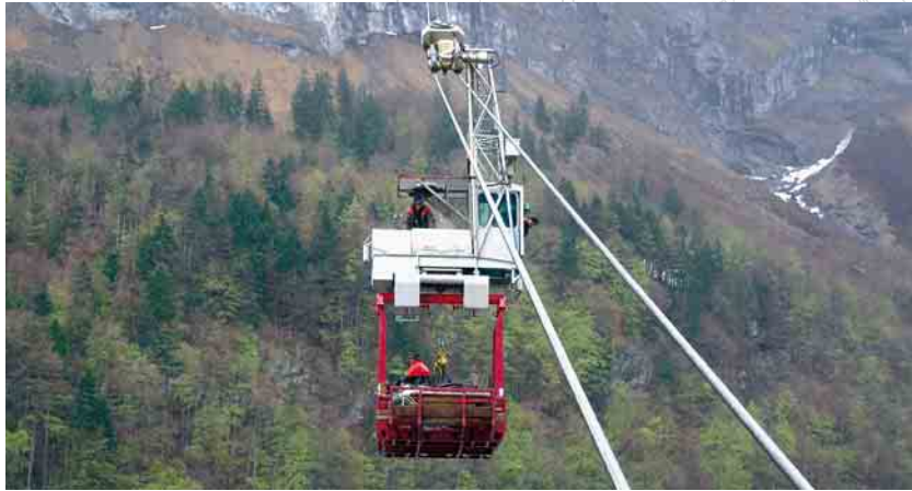
Materialtransport zur Bergstation am neuen Seil

«Sagenhaft abgelegen» liegen die Glarner Kraftwerke Linth-Limmern, wie es in einem Prospekt heisst. Sie wurden von der NOK und dem Kanton Glarus zwischen 1957 und 1968 gebaut und nutzen die Wasserzuflüsse eines rund 140 km 2 grossen Einzugsgebietes im Quellgebiet der Linth. Als Speicherkraftwerk produzieren die KLL