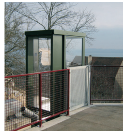
Piccolo-Anlage in Neuenburg...