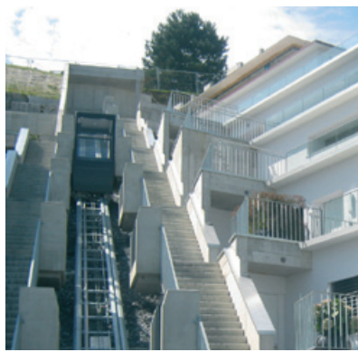
Komfortanlage in Galgenen SZ...

Für das Terrassenhaus La Scala in Galgenen haben wir eine Komfortanlage mit neun Haltestellen, davon sechs beidseitig, gebaut. Die 8-Personen-Kabine bietet allen Komfort und meistert auf Knopfdruck leise und zuverlässig die 50 Meter mit einer Steigung von 26,5 Grad. Eine identische Anlage erschliesst ein Terrassenhaus in Leisenberg BL. Sie brauchen nur