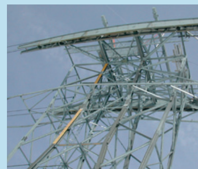
Neue Seilsättel auf 3500 mÜM

Gletscherskigebiet von Tignes. Die 115 Personen fassende Kabine führt über eine Fachwerkstütze. Die Baucorner wurden per Seilbahn und weiteres Material mit Pistenfahrzeug über den Gletscher herbeigeführt. Um die schweren Seilsättel zu ersetzen, wurde das Tragseil temporär auf der Stütze in extra konstruierte Halterungen eingelegt. Weiter wurden die Wartungspodeste getauscht und die Stützen erneuert.