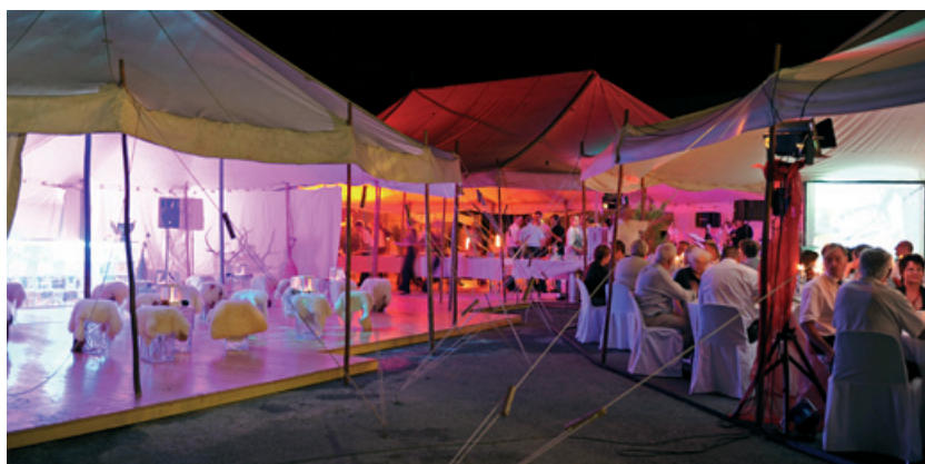
Abendstimmung auf dem festlichen Fabrikareal

währschaften Zwischenverpflegung und diversen Kinderattraktionen überrascht. Und eine Besucherin meinte: «Inauen-Schätti AG ist eine Visitenkarte für Innovationskraft und Leistungen aus dem Glarnerland in der ganzen Schweiz und aller Welt.» Herzlichen Dank für das Kompliment, das uns weiter anspornen wird.