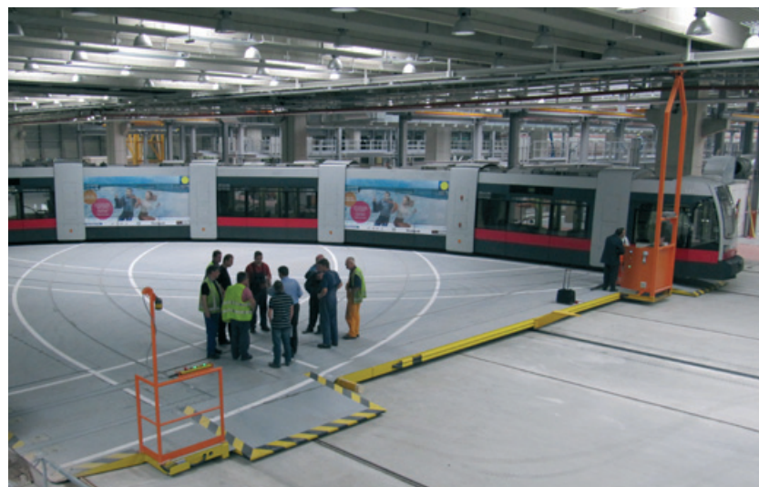
Die Plattform der Inauen-Schätti AG für den langen Ulf von Wien

Was für Zürich gut genug ist, ist auch für Wien recht. Die Inauen-Schätti AG hat auf Grund des hervorragend beurteilten Konzeptes den Auftrag für eine Schiebepöhrne der Wiener Linien erhalten. Die Wiener Strassenbahn «Langer Ulf» erforderte eine ähnliche Plattform in der Zentralwerkstatt. Die Trams sind auf der neuen Schiebepöhrne in gebogener Form angeordnet, womit auch grössere Fahrzeugkompositionen in der Werkstatt bewegt werden können. Wie Projektleiter Martin Stocker erklärt, bewegt sich die Plattform durch vier Reibradantriebe und verschiebt überlange Strassenbahnen und Schleppfahrzeuge auf vier parallel verlaufenden Streckenschienen. Der gesamte Fahrbereich beträgt ca. 150 m.