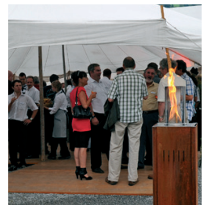
Zu Besuch bei Inauen-Schätti AG