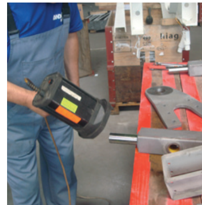
Materialprüfung auf Risse