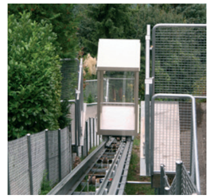
...und in Gunten BE