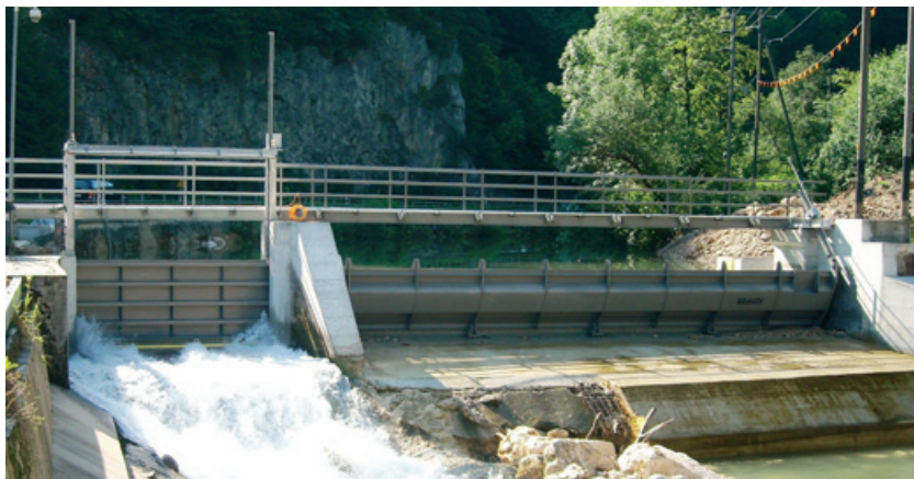
Stauklappe mit Grundablass

Unser Know-how im Maschinenbau, die Fertigung und das Handling mit Stahl sowie unsere langjährige Erfahrung in Montagearbeiten mitten in der oft unwegsamen Natur vereinen sich in unserer neuen Kompetenz: Stahlwasserbau. Schon seit Jahren beschäftigen wir uns mit der Energiegewinnung und sind auf den grössten Kraftwerksbaustellen der Schweiz im Einsatz. Mit der