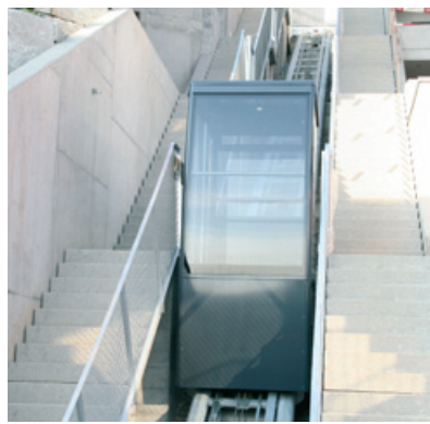
...und in Leisenberg BL

Eine Piccolo-Anlage mit Viererkabine übernimmt den Transport in einer privaten Liegenschaft in Neuenburg und meistert dabei 30 Grad Steigung. Nicht nur Neuanlagen, sondern auch der Modernisierung bestehender Anlagen widmen wir uns gern. In Gunten am Thunersee haben wir eine 25 Jahre alte Streiff-Anlage umgebaut. Auf der bestehenden Fahrbahn fährt eine neue 4er-Piccolo-Kabine, die mit neuem Antrieb, Fahrwerk und Steuerung ausgerüstet wurde.