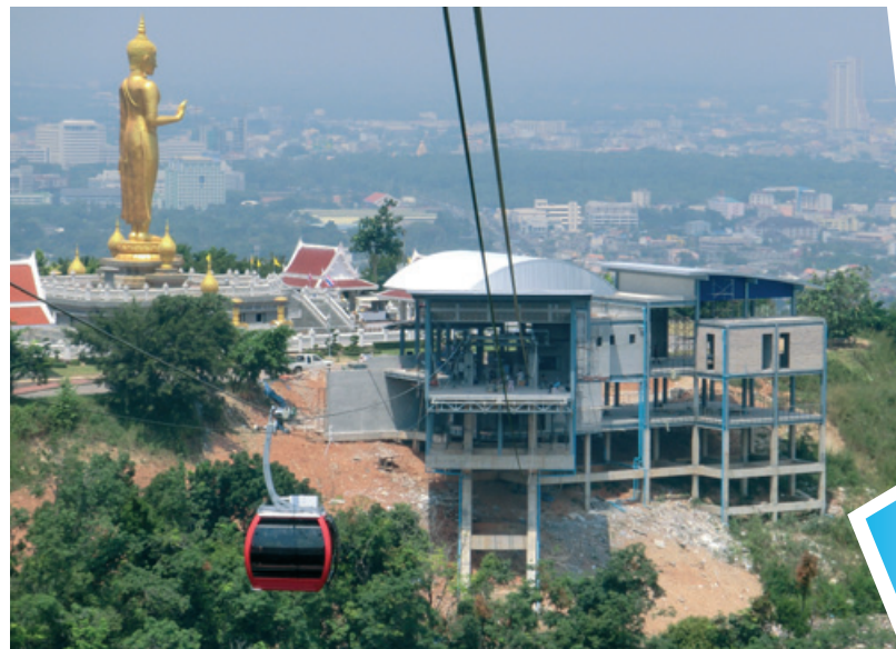
Auch zu einer Pilgerstätte in Thailand führen unsere Bahnen

Die erste Sektion folgt zu einem späteren Zeitpunkt. Im dicht bewaldeten und steilen Gelände wurde für den Seilzug ein neues Konzept angewandt: Mit einem Modellflugzeug wurde das Vorseil eingezogen.